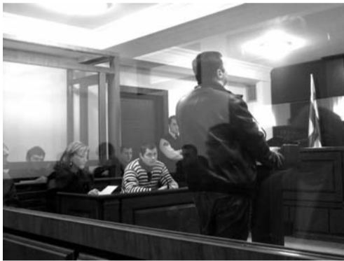
ბოლო ერთი კვირის მანძილზე ქუთაისის საქალაქო სასამართლომ ორი გამამართლებელი განაჩენი დაადგინა.