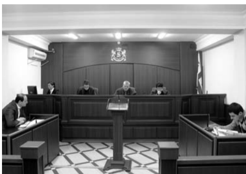
თბილისის სააპელაციო სასამართლოს ადმინისტრაციულ საქმეთა პალატამ შემოსავლების სამსახურის პოზიცია არ გაიზიარა და დავა მეწარმის სასარგებლოდ გადაწყვიტა.