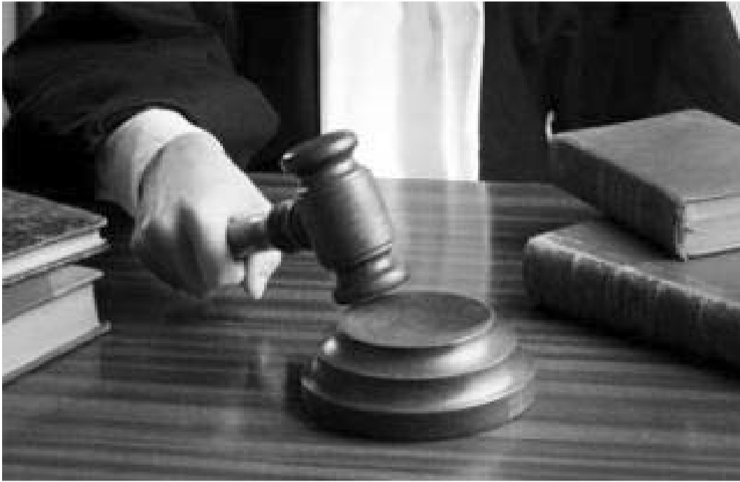
სანინალმდევო გადაწყვეტილებას და მსჯავრდებულს უმცირეს სასჯელს, ან კვალიფიკაციის ნაწილში მის სასარგებლოდ ცვლის გადაწყვეტილებას.

ალსანიშნავია, რომ სააპელაციო ინსტანციის სასამართლოებში განაჩენების 30 პროცენტი იცვლება მსჯავრდებულის სასარგებლოდ. სააპელაციო სასამართლო იღებს პროკურატურის მოთხოვნის