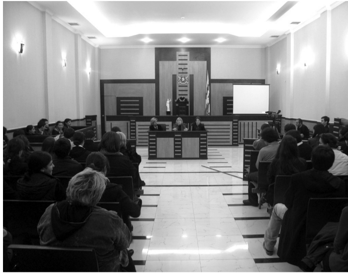
გება. ზემოაღნიშნული ოლიმპიადის კონკრეტული თემისა და საკითხების შერჩევა წინასწარ გამოუქვეყნებლად, სრული კონფიდენციალურობით წარიმართა.

20 ივნისს, 13 საათზე საქართველოს უნივერსიტეტის, თბილისის სახელმწიფო უნივერსიტეტის, საქართველოს ტექნიკური უნივერსიტეტისა და კავკასიის სამართლის სკოლის ბაკალავრიატის მე-3 და მე-4 კურსის სტუდენტები თბილისის საქალაქო სასამართლოს ინიციატივით გამართულ სამართლებრივ ოლიმპიადაში მიიღებენ მონაწილეობას.